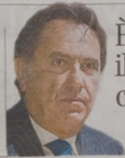
PIOLI ■ A pagina 22

La visita del presidente americano La prima volta di Obama «Con Israele per sempre»